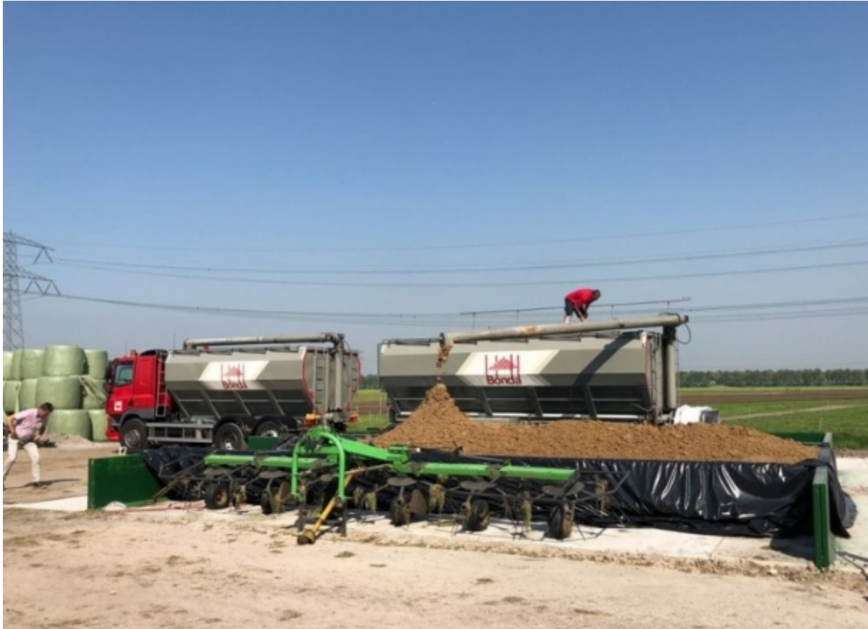
Een volledige vracht bierbostel pas precies in de daarvoor ontworpen sleufsilos.

Om extra opslagcapaciteit te creëren, adviseert veevoerleverancier Bonda bij melkveehouders twee lage sleufsilos aan te leggen waar steeds één vracht bierbostel in kan. Melkveehouders krijgen dan korting op de aankoopkosten van bierbostel , een restproduct van bierbrouwerijen. MBS Beton levert deze sleufsilos.