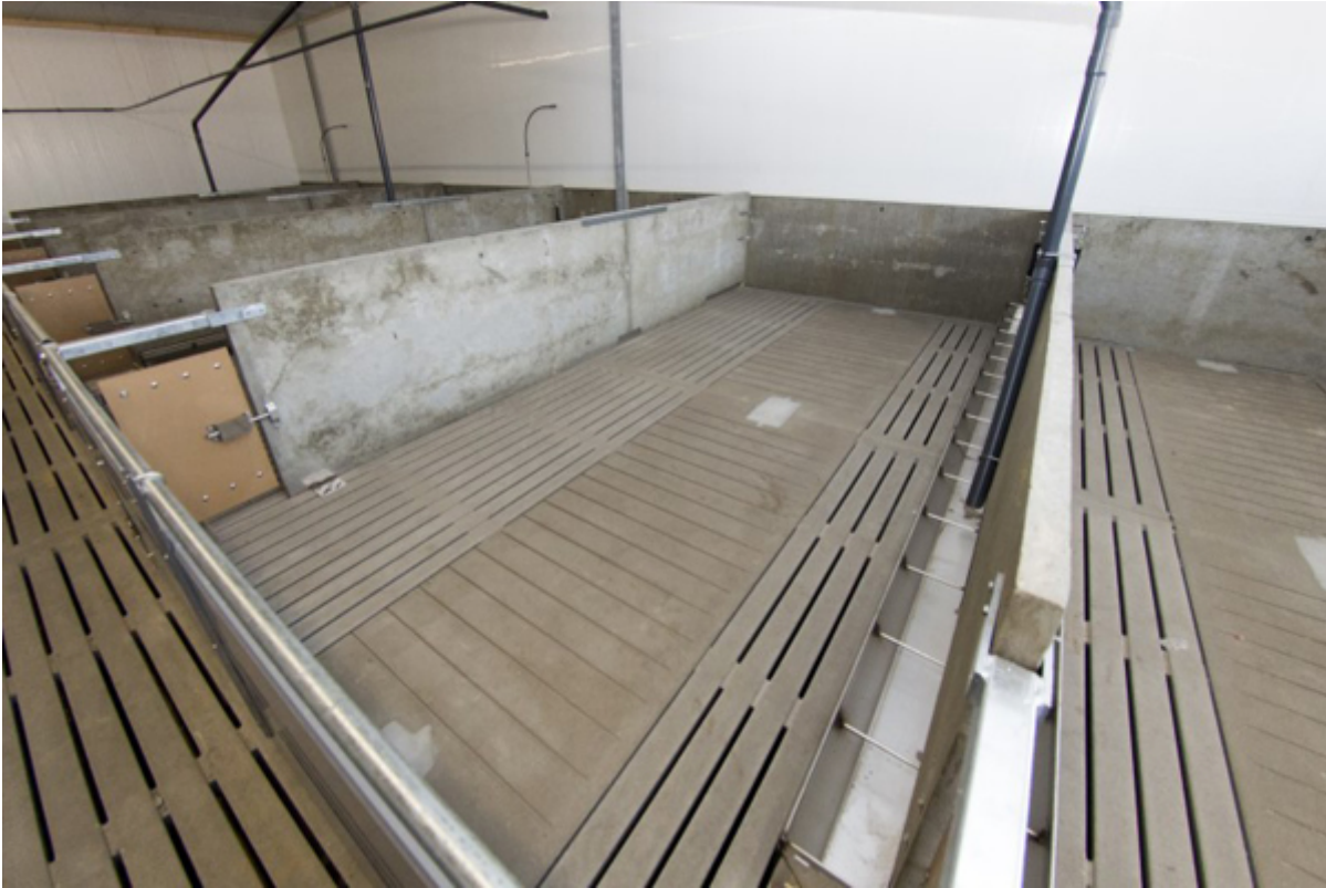
De vloer is vlak en sluit precies aan op andere roosters.

Voor varkensstallen heeft Anders Beton een vlakke verwarmbare betonvloer ontwikkeld met een volledig zuurbestendige toplaag.