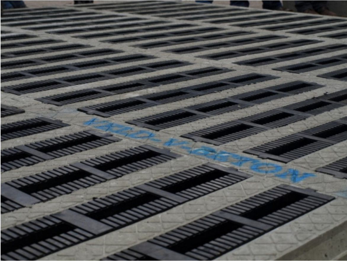
Vloer met rubberen toplaag voor extra koecomfort.

Nu fabrikanten en het ministerie van I&M overeenstemming hebben bereikt over de beoordeling van de meetrapporten, krijgen melkveehouders een ruimere keuze in de emissiearme vloer die ze aan kunnen schaffen.